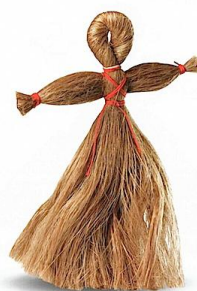
Рисунок 4 – Кукла из льняной пряжи, символизирующая образ Олёны-Льняницы (цит. по: [12])

мени лён среди славян приобрёл настолько высокое значение, что в местностях с традиционным выращиванием этой культуры он персонифицировался в лице целых двух святых христианских покровительниц: Олёны-Льняницы и Параскевы-Пятницы, в традиционных льноводческих регионах известной также как Параскева-Льняниха. А дни начала посева и окончания уборки льна приобрели статус народных обрядов с народными гуляниями. В дни празднования начала посева льна (21 мая / 3 июня) повсеместно в льноводческих губерниях дореволюционной России из льняной пряжи изготавливали в виде кукол полуязыческие символы Олёны-Льняницы (рис. 4) [1; 6; 18]. В XVIII–XIX веках в некоторых регионах современных России, Белоруссии и Украины иконы Параскевы-Льнянихи, как покровительницы уборки льна (28 октября / 10 ноября), покрывали окладами со стилизованным изображением цветущих растений льна (рис. 5).