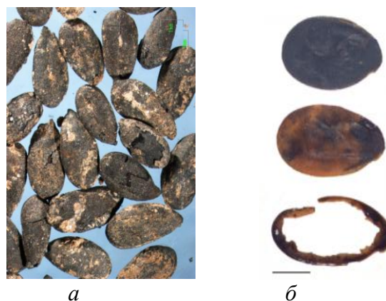
Рисунок 2 – Находки семян льна в неолитических поселениях Южной и Центральной Европы:

На предполагаемое пищевое использование, найденных при раскопках семян культурного льна, также указывают их крупные размеры, близкие к современным масличным сортам льна [31; 32; 36; 38] (рис. 2).