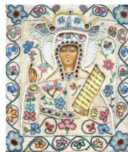
Рисунок 5 – Икона Параскевы-Льнянихи в окладе с изображением цветущих растений льна (Урал, около 1800 г.) (цит. по: [22])

Большой вклад в дальнейшее увеличение производства льна в России внёс царь Пётр I. Создаваемый им морской флот требовал больших поставок льняных парусных тканей и льняного масла. Поэтому в 1705 г. была объявлена свободная торговля льном и разрешён экспорт. А в 1715 г. им были изданы первые в истории России указы, посвящённые льну: – «О