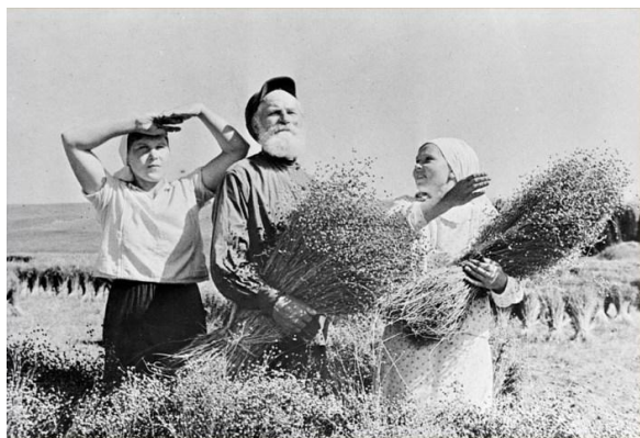
Рисунок 7 – Сборщики льна. СССР, Марийская автономная республика, 30-е годы XX века (цит. по: [8])

Накануне первой мировой войны среднегодовое производство льносемян в мире достигало 2,8 млн т. Первое место по их выращиванию на своих бескрайних субтропических пампасах заняла Аргентина, но и гораздо более холодная Россия тогда уверенно стояла на втором месте. В 1913 г. общая площадь под масличным льнокудряшом в России достигала 400 тыс. га, а валовой сбор льносемян в этом же году составил 590 тыс. т. Однако в период Гражданской войны российское льноводство пришло в упадок. Восстановить производство масличного льна удалось только с началом коллективизации в конце 20-х годов (рис. 7). И уже в 1931 г. в СССР под масличным льном было занято 600 тыс. га, а валовые сборы семян составили 840 тыс. т [19; 20].