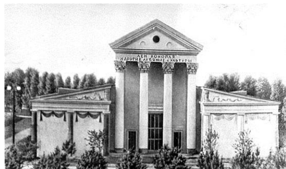
Рисунок 8 – Павильон льна и конопли на Всесоюзной сельскохозяйственной выставке, 1954 г. (цит. по: [21])

ВДНХ) был построен отдельный павильон льна и конопли (рис. 8).