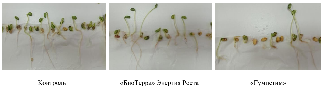
Рисунок 3 – Вид растений сои сорта Зуша, по вариантам, 7-е сутки

Масса сухого вещества корня у семян анализируемых сортов варианта «БиоТерра» Энергия Роста увеличилась по сравнению с контролем: у сорта Зуша на 8,4 %, у сорта Осмонь на 13,2 %, у сорта Ланцетная на 47,1 %, у сорта Мезенка на 8,6 % и у сорта Шатиловская 17 на 57,8 %. У варианта «Гумистим» по тому же показателю наблюдалось увеличение у сортов Осмонь, Ланцетная и Шатиловская 17 на 9,6 %, 57,7 % и 9,8 % соответственно, а у сортов Зуша и Мезенка изменений не наблюдалось.