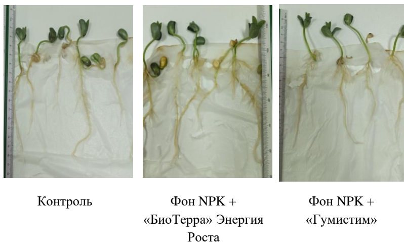
Рисунок 2 – Вид корневой системы растений сорта Ланцетная по вариантам опыта, 7-е сутки

Растения сорта Зуша и Мезенка в вариантах с применением «БиоТерра» Энергия Роста и «Гумистим» были угнетены, у большого количества проростков наблюдались дефекты развития (слабый рост корешков и прекращение роста почечки), обнаружено единичное загнивание семян. В то время как проростки из контрольного варианта отличались дружностью всходов и стандартным развитием (рис. 3–4).